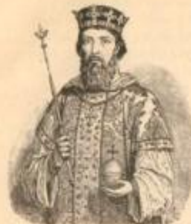
KAZIMIERZ I. ODNOWICIEL.

Ur. r. 1166, wstąpił na tron 1040, um. 1058, panował lat 18.