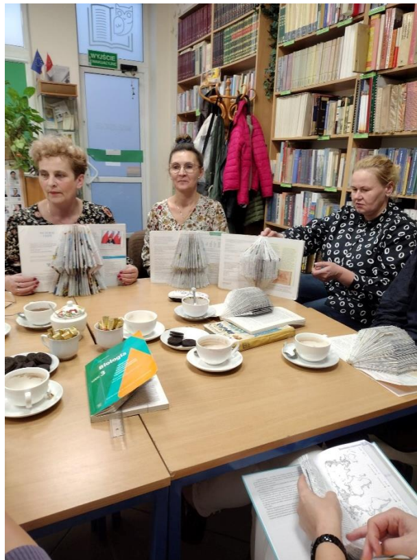
Tekst i fot. K. Kowalczyk