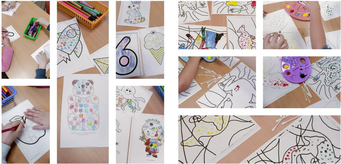
Tekst: K. Kowalczyk