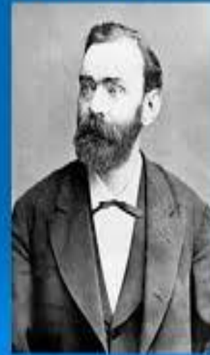
Fundator Nagrody Nobla Alfred Nobel